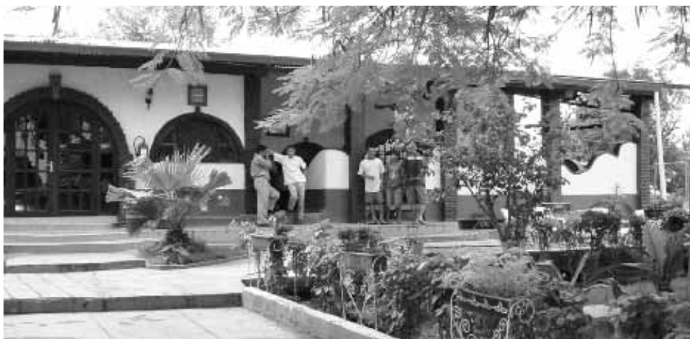
Edificio de la Comunidad Terapéutica “EL MALINCHE”