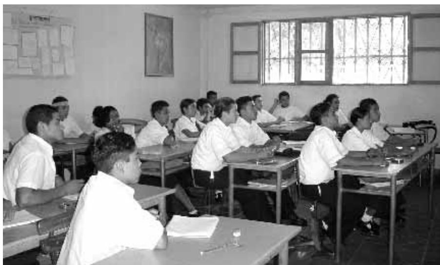
Alumnos del Instituto DIANOVA