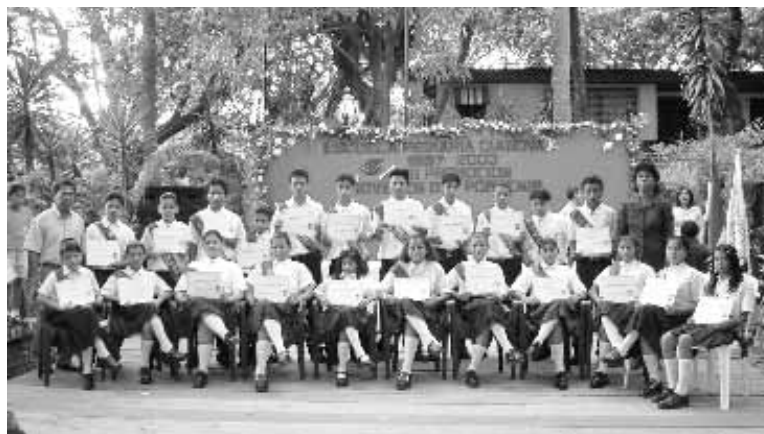
Promocionados de Primaria de la Escuela DIANOVA 2003