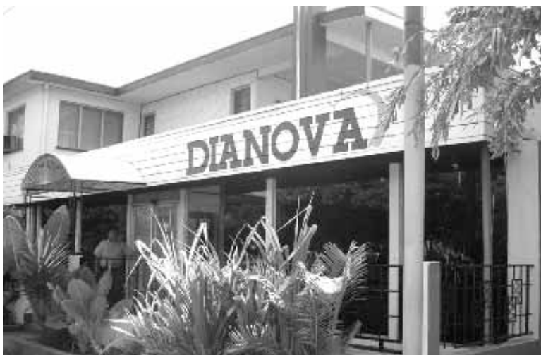
Centro Ambulatorio de Managua (Sede central).

La apertura de un nuevo dispositivo ambulatorio, nos ha permitido ampliar nuestra oferta y mejorar nuestro Programa Terapéutico, ofreciendo a las personas que necesitan de nuestros servicios, una alternativa adecuada a sus necesidades. Se parte de un diagnóstico previo, el cual determina el tratamiento a seguir, ya sea residencial o ambulatorio. Las actividades de cada dispositivo han sido: