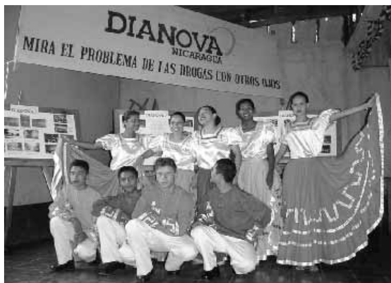
Grupo de Danza DIANOVA