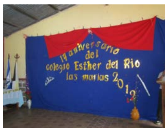
Escenario de celebración