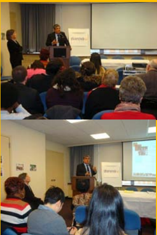
56ava Sesión de la Comisión sobre el estatus de la Mujer

Envíalas a las direcciones electrónicas: comunicacion.ni@dianovanicaragua.org.ni