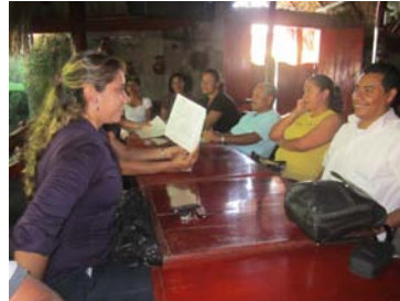
Día del padre